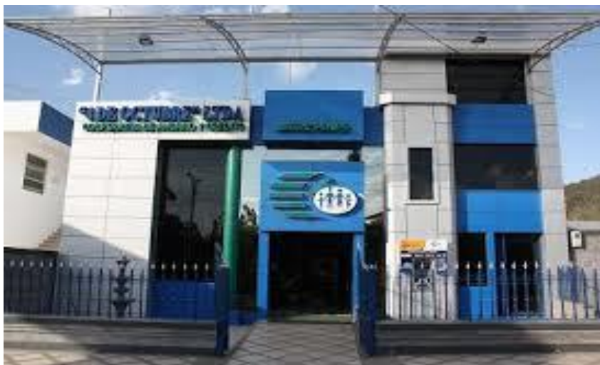
Gráfico 1. Instalaciones de la Cooperativa 4 de Octubre (matriz)

Orientados siempre por su misión, y buscando atender a grupos menos favorecidos, han implementado en su sistema la herramienta de PPI (Estudio de Pobreza) y de esta manera pueden monitorear los niveles de pobreza de sus clientes. Lo cual se considera como una importante fortaleza para la mejor toma de decisiones de la Gerencia General y la Junta.